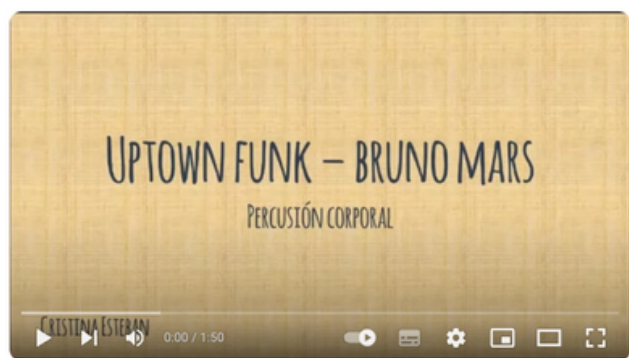
Bruno Mars - Uptown funk - Con percusión corporal